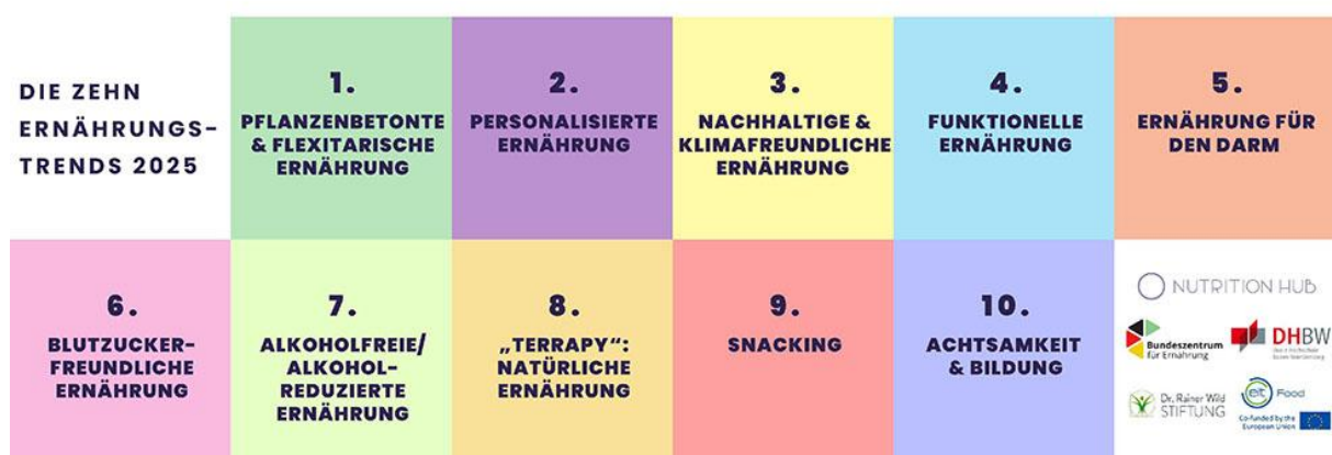
Abbildung 2: NUTRITION IMPACT HUB gUG