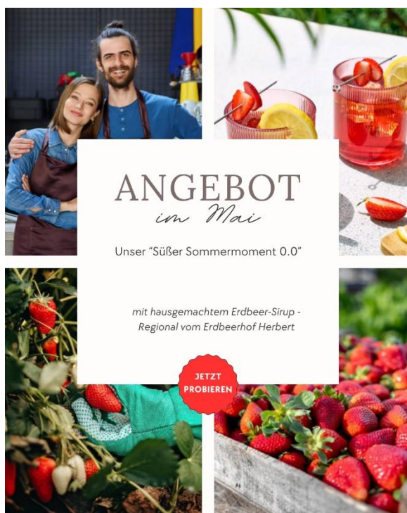
Abbildung 4: Eigene Darstellung & iStock